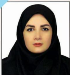
سخن دبیر :

موسسه آموزش عالی جهاد دانشگاهی رشت معاونت فرهنگی و دانشجویی