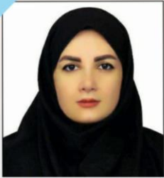
سخن دبیر :

موسسه آموزش عالی جهاد دانشگاهی رشت معاونت فرهنگی و دانشجویی